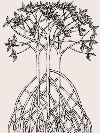
Mangle Negro ( Avicennia germinans )

Entendemos que el mundo natural debe tomar prioridad por encima del crecimiento industrial, económico, y “civilizado”. Es por lo que reconocemos como progreso aquel que se encuentra en la medida en la cual como sociedad nos acerquemos cada vez más a un balance con la naturaleza.