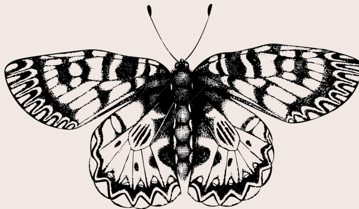
Mariposa Arlequín ( Zerynthia rumina )

Somos una colectiva contestataria al sistema. Nos mueve el amor y la solidaridad para con otros y la naturaleza. Creemos que podemos juntas, ingeniar nuevas formas donde podamos vivir en armonía con todas las vidas que habitan este planeta. Es por ello, que apostamos a abolir el sistema capitalista, como meta para la subsistencia de la vida misma. Una colectiva diversa, ecofeminista, anticlasicista, antirracista, anticapitalista y antimperialista. Nos oponemos a todas las formas de opresión y marginación.