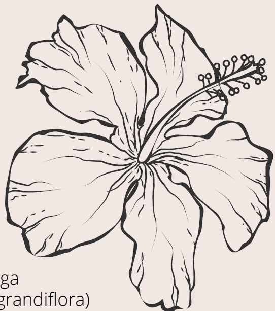
Maga ( Thespesia grandiflora )

Como pueblo hemos demostrado heroicamente que hemos detenido y frustrado las intenciones imperiales, la injusticia, asesinato y explotación de nuestra Isla. Pero es necesario comprometernos a la destrucción del sistema capitalista y la liberación para lograr alcanzar la justicia social y ambiental que necesitamos.