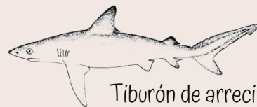
Tiburón de arrecife del Caribe, (Carcharhinus Perezi)

Apostamos a la trinchera del amor, el juego y la alegría, para abrazar la lucha recia. Para recuperar de todos los pueblos del mundo la cosmovisión de que es posible vivir en armonía con la naturaleza. Con la creatividad de la imaginación para frenar la explotación a la naturaleza y atender las emergencias climáticas desde la solidaridad, el apoyo mutuo y equilibrio con la Tierra y los ecosistemas que cohabitamos en ella.