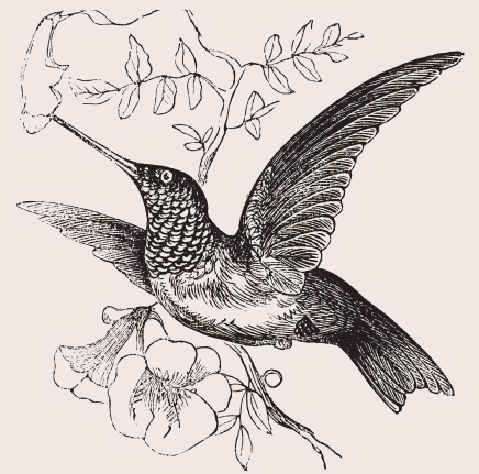
Zumbadorcito de Puerto Rico ( Riccordia maugaeus )

Pero estamos más que nunca convencidos que no es posible hablar, denunciar problemáticas ambientales o ejecutar acciones “verdes”, sin cuestionar la raíz del problema; el sistema capitalista. Es por ello, que iniciamos el 2021 compartiendo nuestro trabajo en progreso, con la esperanza que juntas podamos erradicar en un futuro las fuerzas destructivas que sostiene el sistema y forjemos nuevas formas de relacionarnos entre personas y naturalezas que permitan la subsistencia real y plena de todas las vidas.